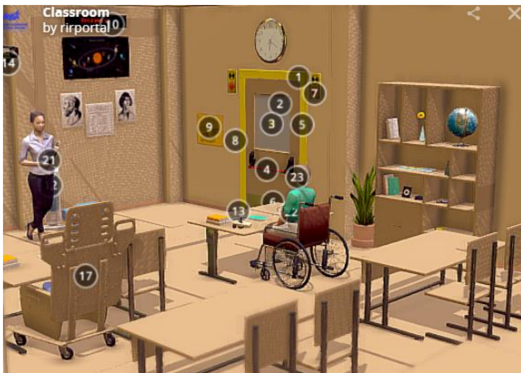
Рис.2. Модельное решение (общий вид)