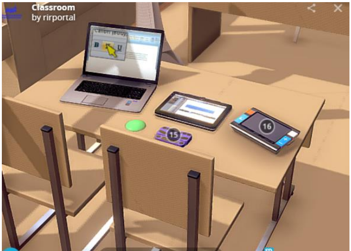
Рис.5. Модельное решение (адаптированная компьютерная техника)