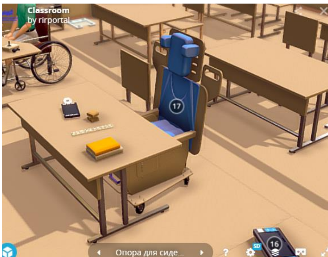
Рис.3. Модельное решение (ученический стол)