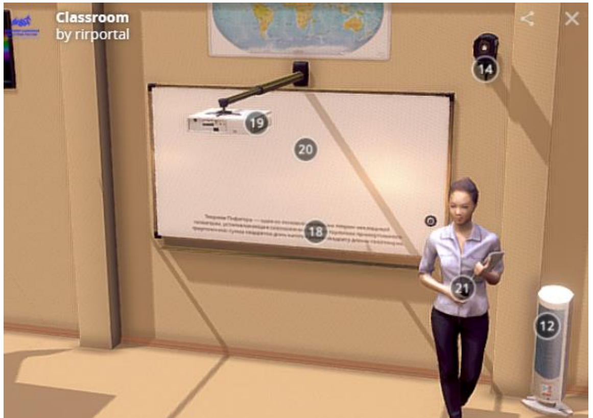
Рис.7. Модельное решение (проектор с интерактивной доской)