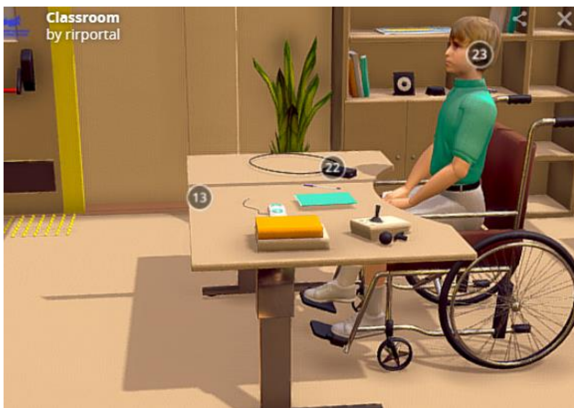
Рис.4. Модельное решение (ученический стол)